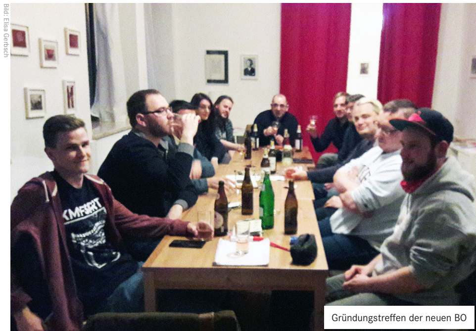
Gründungstreffen der neuen BO